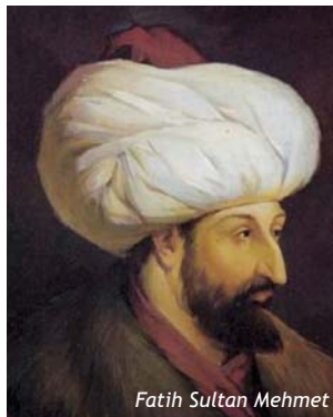
Fatih Sultan Mehmet

Dertliyiz ama dermanı da bizde bir nevi... Çözümler üzerinde düşünmeyi ve bunları hayata geçirmeyi denediğimiz vakit, hepsinin tek tek çözümlüvereceğini göreceğiz." Bir daha düşünelim mi? Bir öğrencinin derdi nedir? Sınavlar... O sınava, bu sınava hazırlanıyor, okuluna hazırlanıyor. Ne için? İyi bir meslek sahibi olabilmek için, bunu neden istiyor? İyi bir yaşama kavuşmak için... Derdi bu işte... Acaba derdimiz olmasaydı, yaşayabilir miydik? Bu pencereden baktığımız zaman, derdimizin aslında bizi yaşama bağladığını söylesek yanlış bir tespit mi bulunmuş oluruz? Dertimizi sevmemiz, bizi daha fazla yaşama bağlar desek, çok mu uçuk bir söz sarfetmiş oluruz?